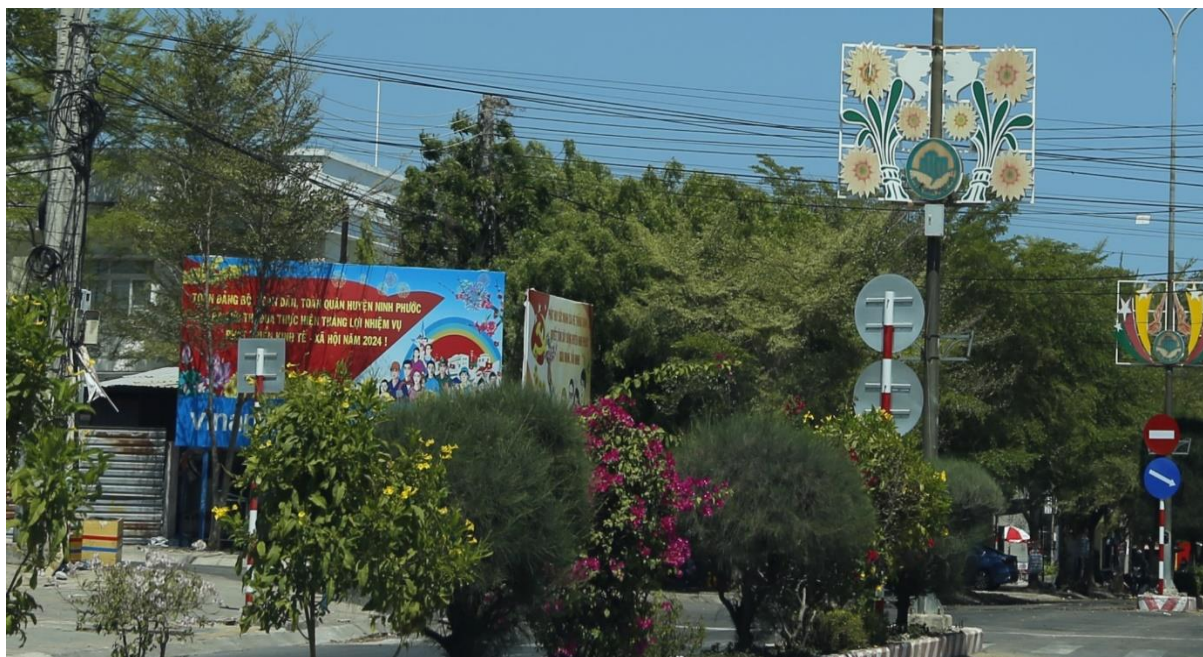
Bảng tuyên truyền đường Nguyễn Huệ, huyện Ninh Phước