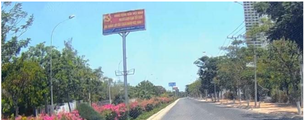
Bảng tuyên truyền kết hợp quảng cáo trên dải phân cách, đường Yên Ninh, Tp. Phan Rang - Tháp Chàm

Quảng cáo treo trên cột đèn, cột điện thường do cá nhân, hộ kinh doanh nhỏ tự phát.