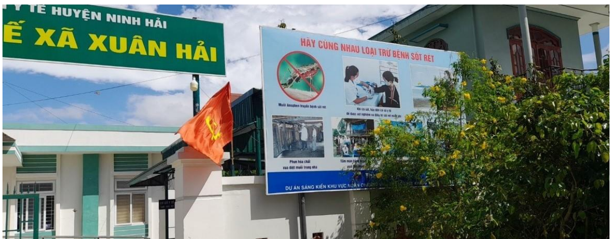
Bảng tuyên truyền trước trạm Y tế xã Xuân Hải, huyện Ninh Hải

Hệ thống bảng rôn chằng ngang đường không được quan tâm khai thác, theo xu thế chuyển đổi số tích cực diễn ra trên cả nước nói chung và ở tỉnh Ninh Thuận nói riêng, việc tuyên truyền bằng bảng rôn ngang đường đã không còn hiệu quả như trước.