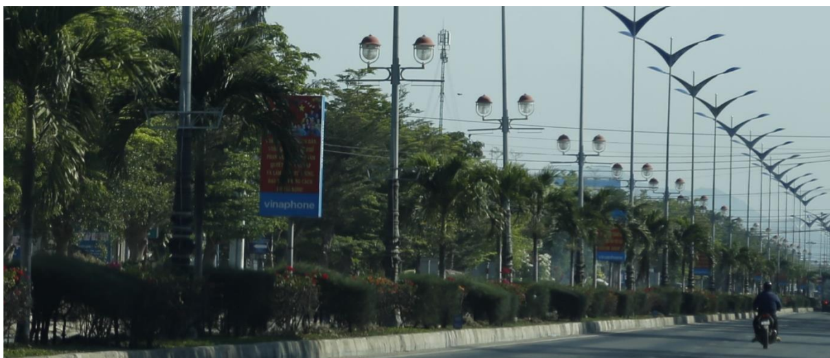
Bảng trên dải phân cách đường Lê Duẩn, Tp. Phan Rang - Tháp Chàm

người đi bộ do chữ bé hoặc bị cây, cột đèn trên dải phân cách che khuất.