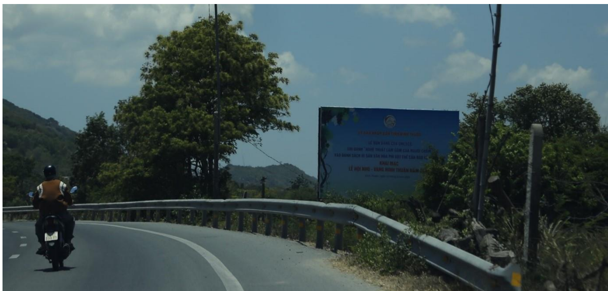
Bảng tuyên truyền giáp ranh tỉnh Khánh Hòa, QL1A, huyện Thuận Bắc,

Tại một số vị trí giáp ranh đã có lắp dựng các bảng tuyên truyền bằng các vật liệu thô sơ khung sắt mặt bạt hiflex, kích thước nhỏ khoảng 15 m 2 – 30 m 2 , chưa thể hiện được sự trang trọng, thẩm mỹ nhưng phần nào phát huy tác dụng, một số vị trí chưa được quan tâm bị cây che khuất, rách, hỏng, vị trí không còn phù hợp do điều kiện phát triển của tỉnh.