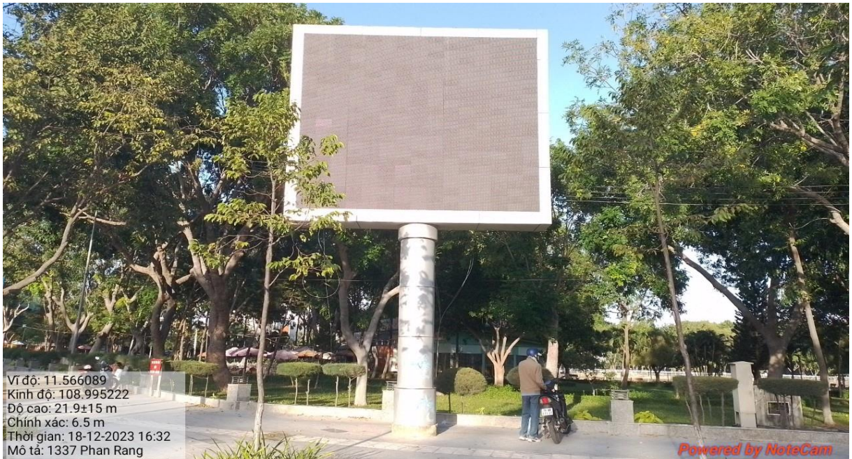
Màn hình LED ngã tư đường Ngô Gia Tự - đường Mười Sáu Tháng Tư, thành phố Phan Rang – Tháp Chàm