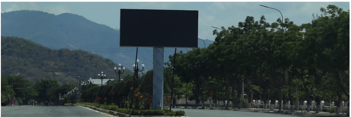
Màn hình LED dải phân cách trước Trung tâm VH-TT huyện Bắc Ái

Về hoạt động tuyên truyền, cổ động chính trị, phục vụ lợi ích xã hội như tuyên truyền về các dịch vụ bảo hiểm xã hội, bảo hiểm y tế; tuyên truyền về hôn nhân và gia đình,... đã góp phần tích cực trong việc tuyên truyền giải quyết các vấn đề an sinh xã hội và đẩy lùi các tệ nạn xã hội.