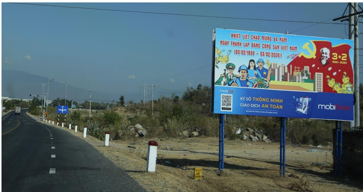
Bảng tuyên truyền Quốc lộ 27, huyện Ninh Sơn

và treo băng rôn ở các khu vực trung tâm thành phố, huyện và trên các trục đường giao thông, nơi cửa ngõ vào địa bàn; tuyên truyền tại trạm tin, bảng tin ở khu vực xã, phường, thị trấn và ở khu dân cư. Đây là hình thức tuyên truyền chủ đạo và có tác dụng lớn trong việc thông tin tuyên truyền các chủ trương, đường lối của Đảng, chính sách, pháp luật của Nhà nước gắn với những ngày lễ, kỷ niệm, các sự kiện của đất nước, của địa phương.