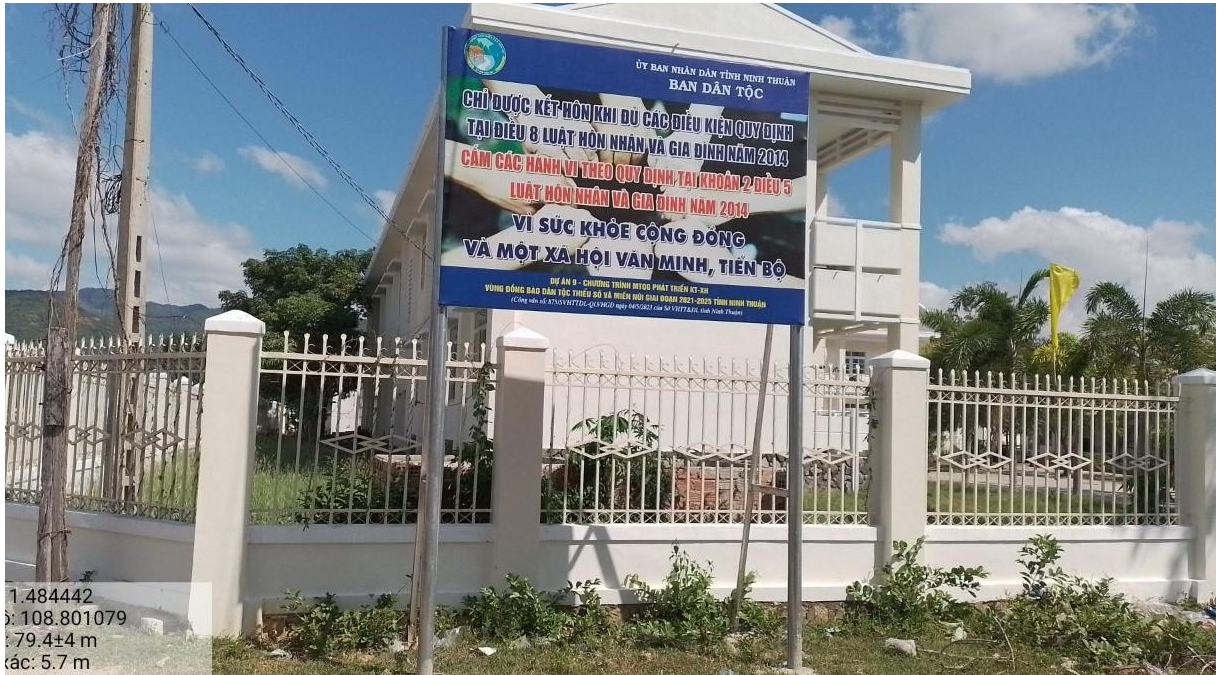
Bảng tuyên truyền gần Trường PTDT bán trú - THCS Phước Hà, huyện Ninh Phước

Trong thời gian qua, một số đơn vị thực hiện việc treo, đặt, dán, dựng bảng, băng rôn tuyên truyền, cổ động chính trị, phục vụ lợi ích xã hội nhưng chưa chú trọng giám sát, kiểm tra để xảy ra tình trạng bảng bị hoen rỉ, bạc màu, rách nát bảng tập trung vào một chỗ, kích cỡ, cao thấp khác nhau.