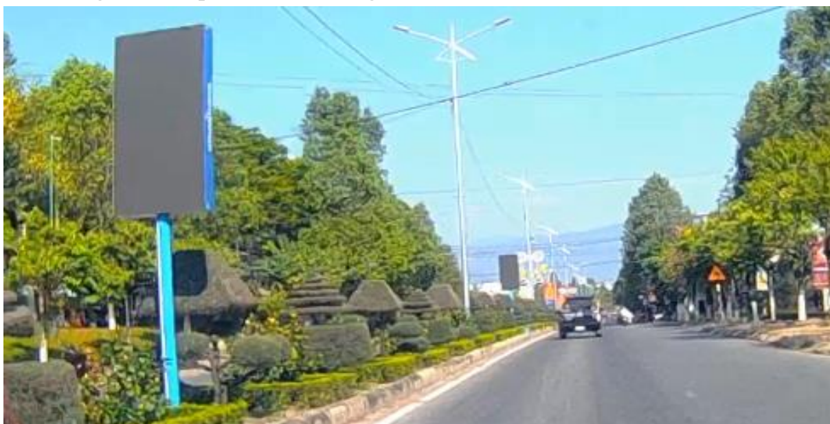
Bảng trên dải phân cách QL1A, huyện Ninh Sơn

Nhìn chung, hoạt động tuyên truyền, cổ động chính trị, phục vụ lợi ích xã hội trên địa bàn tỉnh đã có những thay đổi góp phần tích cực trong việc phát triển kinh tế, văn hoá - xã hội của tỉnh, đã có nhiều loại hình tuyên truyền phong phú, đa dạng. Tuy nhiên, hoạt động tuyên truyền còn nhỏ lẻ, chưa theo trật tự, quy mô và trên những vị trí không đồng bộ về cơ sở hạ tầng và chưa thực sự hiệu quả. Công tác xã hội hóa trong hoạt động tuyên truyền theo hình thức tài trợ xã hội hóa xây dựng bảng tuyên truyền phục vụ nhiệm vụ chính trị ở tỉnh chưa nhiều, chưa huy động, thu hút được nhiều các tổ chức, cá nhân, doanh nghiệp tham gia đầu tư; việc tài trợ mới chỉ dừng lại ở một số đề án nhỏ, quy mô nhỏ. Tài trợ cho các hoạt động tuyên truyền lớn còn hạn chế vì các biện pháp khuyến khích chưa đủ hấp dẫn các nhà tài trợ.