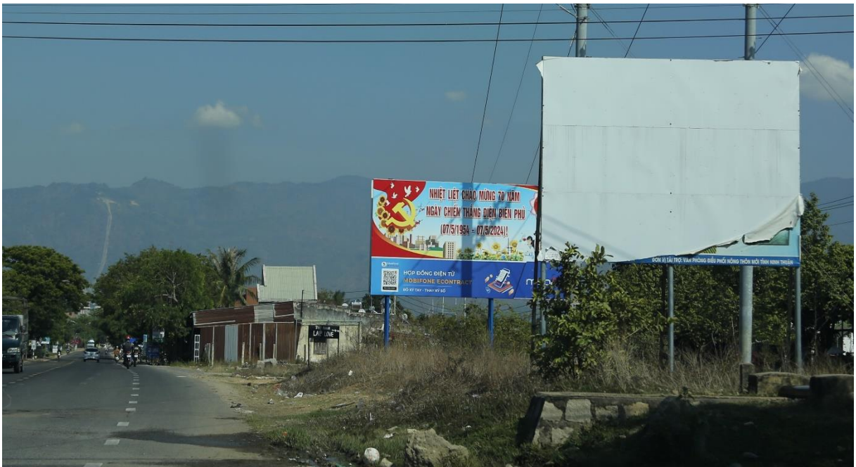
Cụm bảng tuyên truyền tại QL27, huyện Ninh Sơn

Trong thời gian qua, một số đơn vị thực hiện việc treo, đặt, dán, dựng bảng, băng rôn tuyên truyền, cổ động chính trị, phục vụ lợi ích xã hội nhưng chưa chú trọng giám sát, kiểm tra để xảy ra tình trạng bảng bị hoen rỉ, bạc màu, rách nát bảng tập trung vào một chỗ, kích cỡ, cao thấp khác nhau.