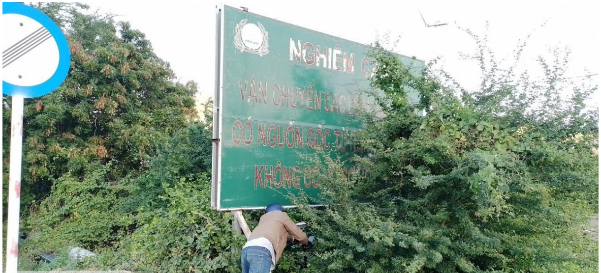
Bảng tuyên truyền QL1A, gần Trạm thu phí BOT Cà Ná, huyện Ninh Phước

Trên một số tuyến đường, bảng tuyên truyền khiêm tốn lấp ló sau hàng cây, có những bảng bị cây che khuất hoàn toàn mất hết tác dụng và có thể gây phản cảm.