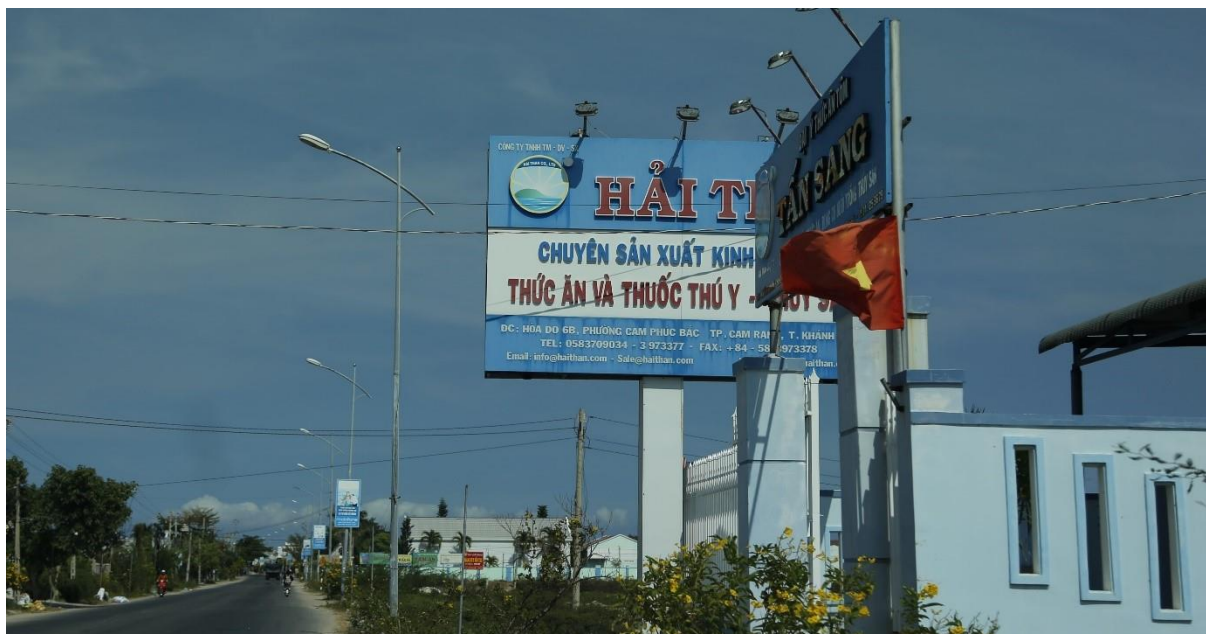
Bảng quảng cáo Đường tỉnh 702, huyện Ninh Hải

hạn chế nhất định như tình trạng mất mỹ quan của các bảng quảng cáo. Nhiều bảng làm bằng chất liệu sắt, nhiều cột, kích cỡ khác nhau, không thống nhất, mặt bảng bị hoen ố, rách nát, không có nội dung, các trụ bị han gỉ, nhiều bảng còn tro nguyên khung, mặt sắt, bị cây hoặc công trình che khuất không hiệu quả.