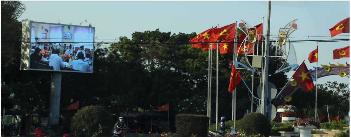
Màn hình LED ngã tư đường Trường Chinh – đường Yên Ninh, huyện Ninh Hải