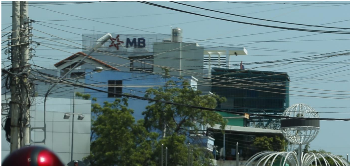
Bảng quảng cáo trên nóc nhà, ngã tư đường Thống Nhất - đường Mười Sáu Tháng Tư