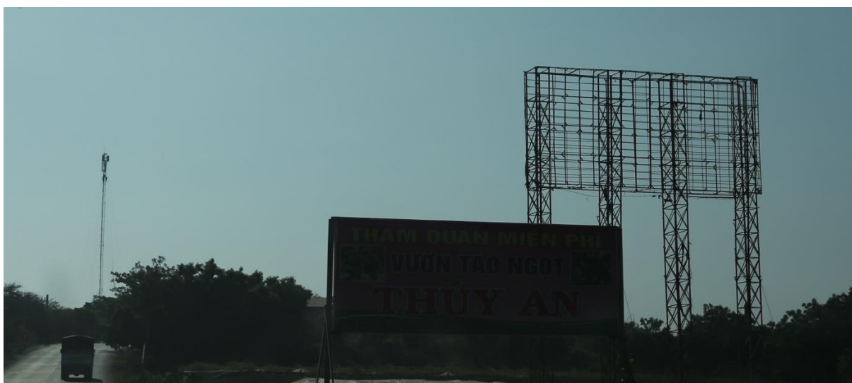
Quốc lộ 27, huyện Ninh Sơn