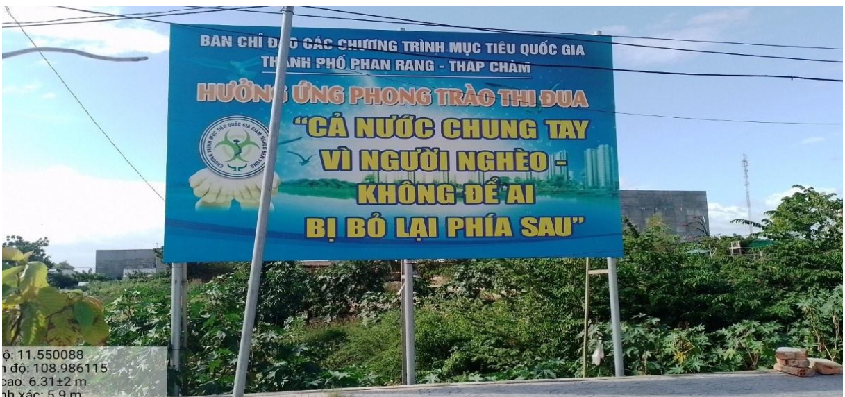
Bảng tuyên truyền ngã ba đường Thống Nhất – đường Trần Nhật Duật, thành phố Phan Rang - Tháp Chàm

Về hoạt động tuyên truyền, cổ động chính trị, phục vụ lợi ích xã hội như tuyên truyền về các dịch vụ bảo hiểm xã hội, bảo hiểm y tế; tuyên truyền về hôn nhân và gia đình,... đã góp phần tích cực trong việc tuyên truyền giải quyết các vấn đề an sinh xã hội và đẩy lùi các tệ nạn xã hội.