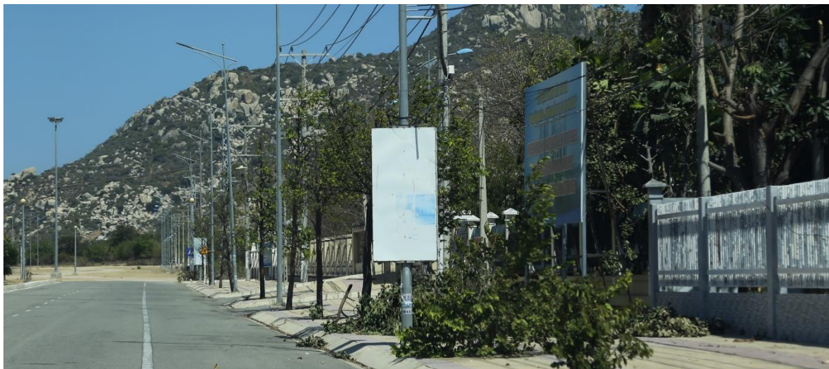
Bảng tuyên truyền trên vỉa hè sát Điện lực Thuận Nam, huyện Thuận Nam

Tại trung tâm các huyện, bảng tuyên truyền tầm nhỏ vẫn sử dụng các vật liệu, công nghệ cơ bản khung sắt mặt bạt hiflex, gắn vào hàng rào hoặc hông tường nhà, đặc biệt việc đa phần các bảng gắn song song với đường kém phát huy hiệu quả, phục vụ chủ yếu cho người đi bộ.