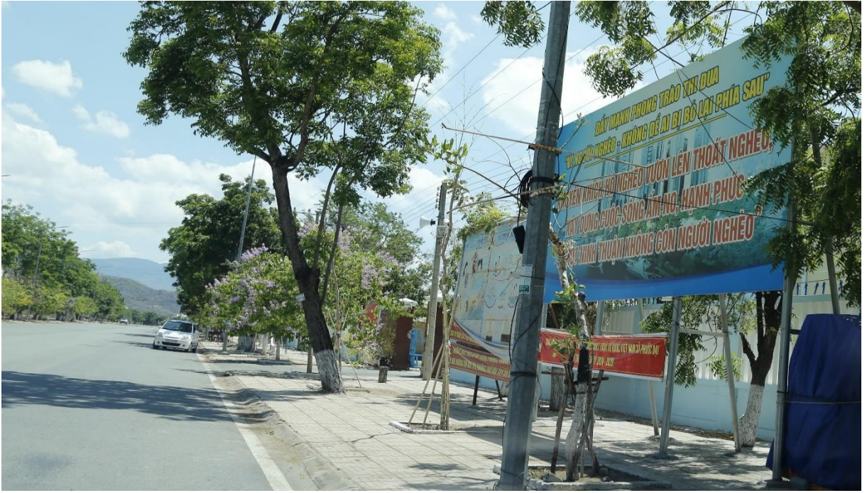
Bảng tuyên truyền phía trước UBND xã Phước Đại, huyện Bắc Ái