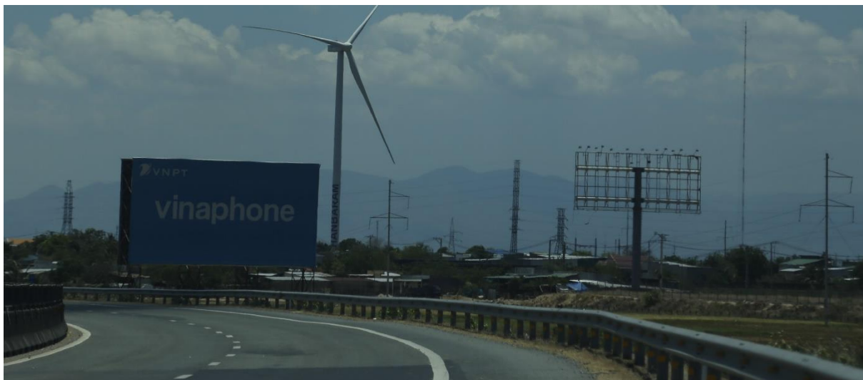
Bảng quảng cáo đứng độc lập Quốc lộ 1A, huyện Thuận Bắc

điều chỉnh về vị trí và kích thước. Một số bảng khung giàn sắt gỉ sẽ phải tháo dỡ và thay thế bằng các bảng quảng cáo theo quy chuẩn của tỉnh, chủ yếu là chất liệu khung sắt, mặt tôn và bạt hiflex.