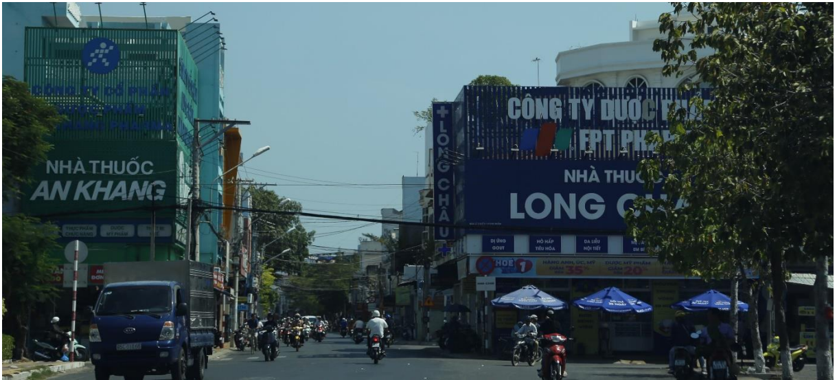
Bảng quảng cáo gắn/ốp công trình ngã tư đường Trần Hưng Đạo - đường Thống Nhất