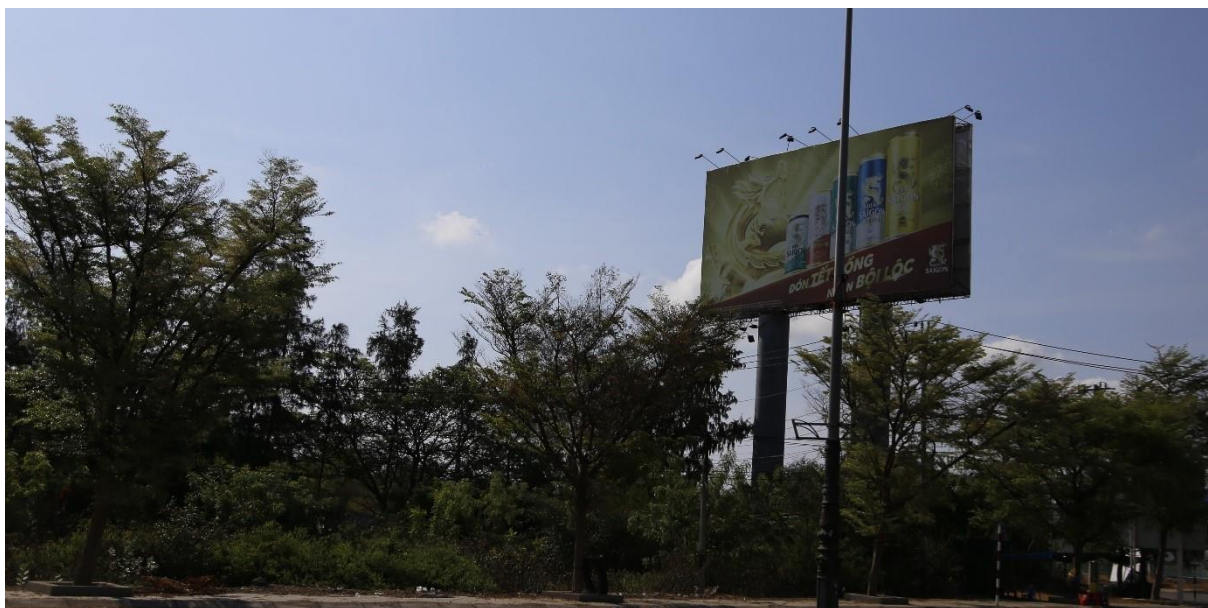
Bảng quảng cáo Quốc lộ 1A, thành phố Phan Rang - Tháp Chàm

Những năm gần đây, quảng cáo ngoài trời của cả nước ngày càng phát triển cả về số lượng và chất lượng, tuy nhiên quảng cáo ngoài trời tại tỉnh Ninh Thuận vẫn ở mức khiêm tốn, chủ yếu tập trung tại tuyến Quốc lộ 1A, Quốc lộ 27 và một số tuyến đường đông người qua lại. Đối với hoạt động sản xuất, kinh doanh của các tổ chức, cá nhân sản xuất kinh doanh trong tỉnh, quảng cáo ngoài trời giúp quảng bá, hỗ trợ đầu ra cho sản phẩm, khiến các đơn vị thực hiện cạnh tranh lành mạnh, giúp cho người dân có nhiều sự lựa chọn hàng hoá và các dịch vụ, góp phần tích cực đẩy mạnh sự phát triển của nền kinh tế hàng hoá, tác động làm quá trình sản xuất lưu thông - phân phối tăng nhanh, giải quyết được nhiều việc làm cho người lao động và đóng góp thêm ngân sách cho tỉnh. Hoạt động quảng cáo ngoài trời cũng góp phần giới thiệu sản phẩm, hàng hoá, dịch vụ của các doanh nghiệp trong và ngoài tỉnh đến người dân Ninh Thuận. Đồng thời quảng cáo ngoài trời tác động tốt đến nhận thức và thẩm mỹ của công chúng, làm tăng vẻ đẹp cảnh quan của tỉnh.